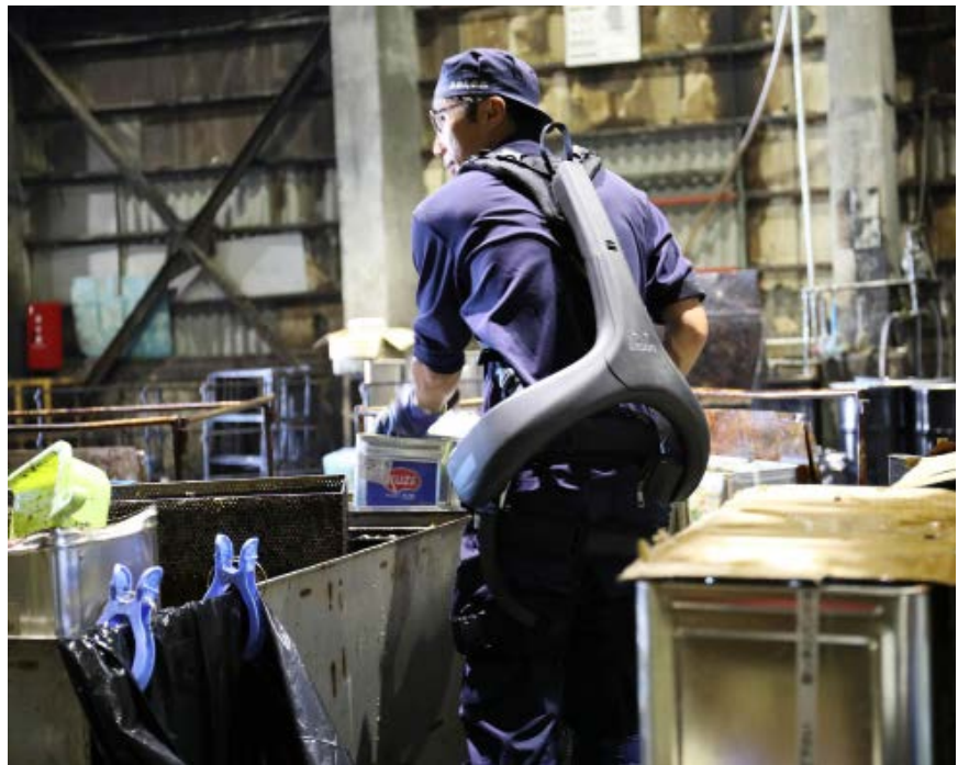
Man met gemotoriseerd exoskelet van Atoun, onderdeel van Panasonic. Samen met de CRAY van GBS op dit moment de enige aangedreven industriële exoskeletten op de markt (bron: internet). Beide ontlasten de onderrug bij het tillen.

We hebben gekeken naar de beroepen/beroepsgroepen waar volgens de meest recente NEA een groot percentage van de medewerkers zegt met zware fysieke belasting te maken te hebben. Onze conclusie is dat een groot deel van deze